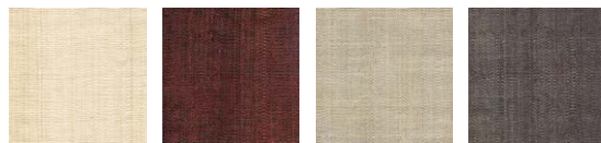
CMO FAB 01 01