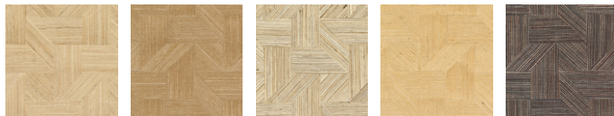
CMO WSI 06 12