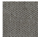
CMO APL 02 04