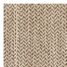
CMO APL 02 03