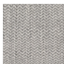
CMO APL 02 02