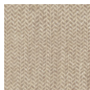
CMO APL 02 01