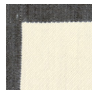
CMO APL 03 05