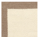
CMO APL 03 03