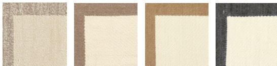
CMO APL 03 01