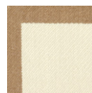
CMO APL 03 04