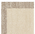
CMO APL 03 01