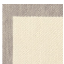
CMO APL 03 02