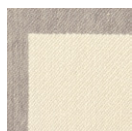
CMO APL 03 02