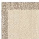
CMO APL 03 01