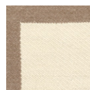
CMO APL 03 03