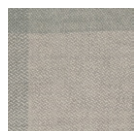
CMO APL 04 05