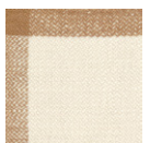
CMO APL 04 03