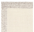
CMO APL 04 01