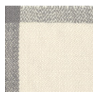
CMO APL 04 04