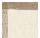
CMO APL 04 02