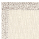
CMO APL 04 01