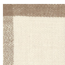
CMO APL 04 02