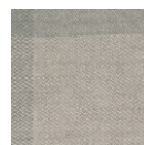
CMO APL 04 05