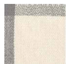
CMO APL 04 04