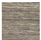
CMO FAB 24 70