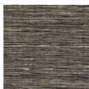
CMO FAB 24 80