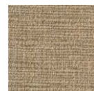
CMO FLI 02 78