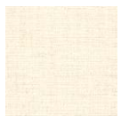
CMO FLI 02 02