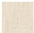
CMO FLI 02 05