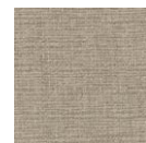
CMO FLI 02 85