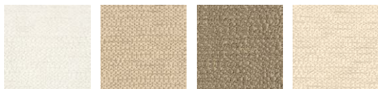
CMO FLI 03 01