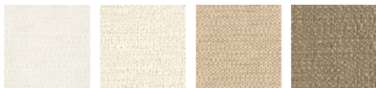
CMO FLI 03 01