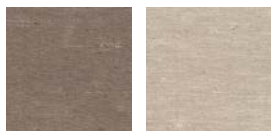
CMO FSO 03 76 CMO FSO 03 82