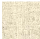
CMO FSO 04 01