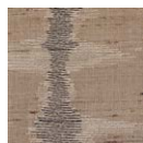
CMO FSO 05 86