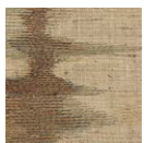
CMO FSO 05 78