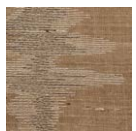
CMO FSO 05 70