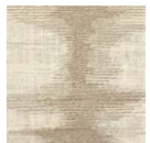
CMO FSO 05 01