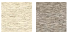
CMO FSO 06 01 CMO FSO 06 86