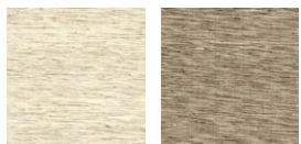
CMO FSO 06 01 CMO FSO 06 70