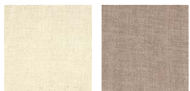
CMO FSO 07 01