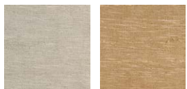
CMO FSO 09 86 CMO FSO 09 92