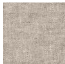
CMO FYA 02 82