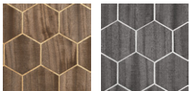
CMO WBO 03 70 CMO WBO 03 86