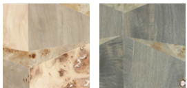
CMO WBO 04 81 CMO WBO 04 86