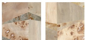
CMO WBO 04 15 CMO WBO 04 81