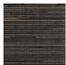
CMO WCU 01 67