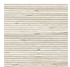
CMO WCU 01 01