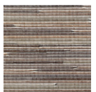
CMO WCU 01 05