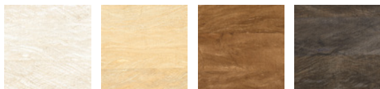
CMO WMU 01 01 CMO WMU 01 10 CMO WMU 01 70 CMO WMU 01 75