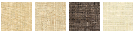
CMO WRA 05 20