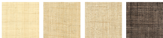
CMO WRA 05 01