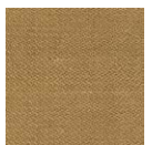
CMO FBA 03 70