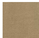
CMO FBA 03 90