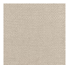
CMO FBA 03 88