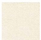
CMO FBA 03 01