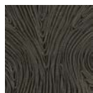
CMO FEX 01 70