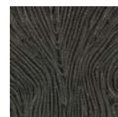
CMO FEX 01 82