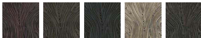
CMO FEX 01 31