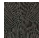
CMO FEX 01 82