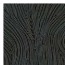
CMO FEX 01 80