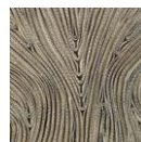
CMO FEX 01 81