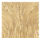
CMO FEX 01 01