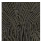
CMO FEX 01 70