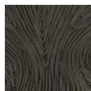
CMO FEX 01 70