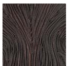
CMO FEX 01 31