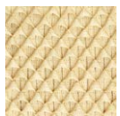
CMO FEX 05 01