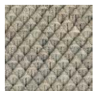
CMO FEX 05 81