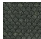
CMO FEX 05 82