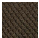
CMO FEX 05 70