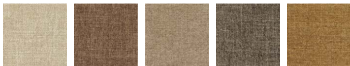
CMO FLI 05 10