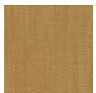
CMO FSO 10 70