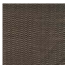
CMO FSO 10 75