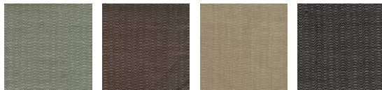
CMO FSO 10 45