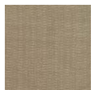
CMO FSO 10 78