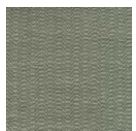
CMO FSO 10 45