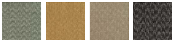
CMO FSO 10 45