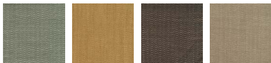
CMO FSO 10 45