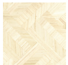
CMO WAB 07 01