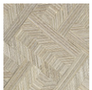
CMO WAB 07 81