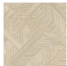
CMO WAB 07 86