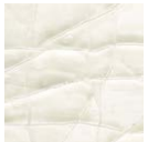
CMO WCA 01 02