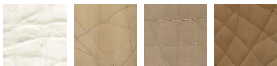
CMO WCA 01 02 CMO WCA 01 15 CMO WCA 01 20 CMO WCA 01 90