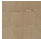
CMO WCA 01 20