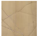
CMO WCA 01 15