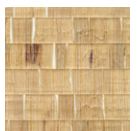
CMO WNE 01 20