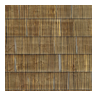
CMO WNE 01 70