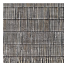
CMO WNE 01 81