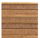
CMO WPN 01 25