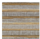
CMO WPN 01 86