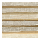
CMO WPN 01 10