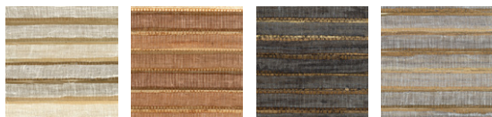
CMO WPN 01 10