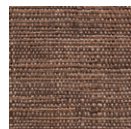
CMO WRA 01 75