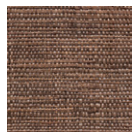
CMO WRA 01 75