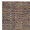
CMO WRA 01 80