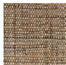
CMO WRA 01 70