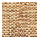
CMO WRA 01 20