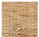
CMO WRA 01 20