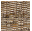
CMO WRA 01 70