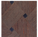
CMO WSO 03 48