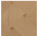
CMO WSO 03 20