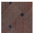
CMO WSO 03 48