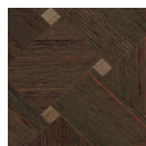
CMO WSO 03 68