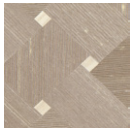
CMO WSO 03 15