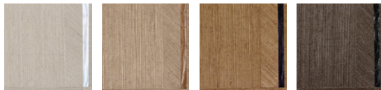
CMO WSI 03 I0