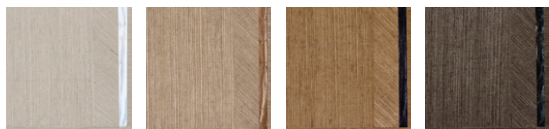
CMO WSI 03 I0