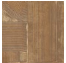
CMO WCA 03 20