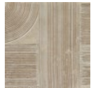
CMO WCA 03 88