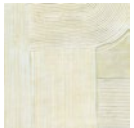
CMO WCA 03 02