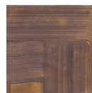
CMO WCA 03 90