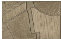
CMO WCA 05 20 A