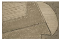
CMO WCA 05 20 B