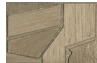
CMO WCA 05 20 D