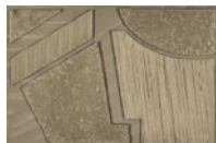
CMO WCA 05 20 A