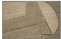
CMO WCA 05 20 B