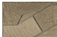
CMO WCA 05 20 C